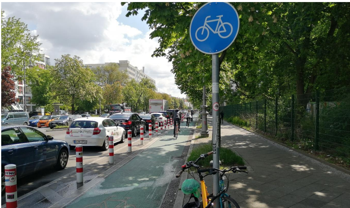
Abbildung 1 Geschützter Radfahrstreifen an der Hasenheide