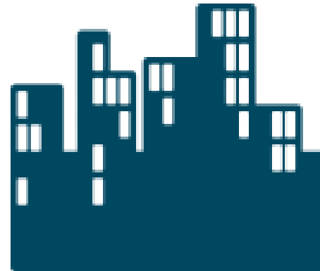
+Ziele nachhaltiger Stadtentwicklung