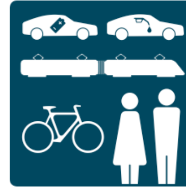
Mobilitätsverhalten & Verkehr