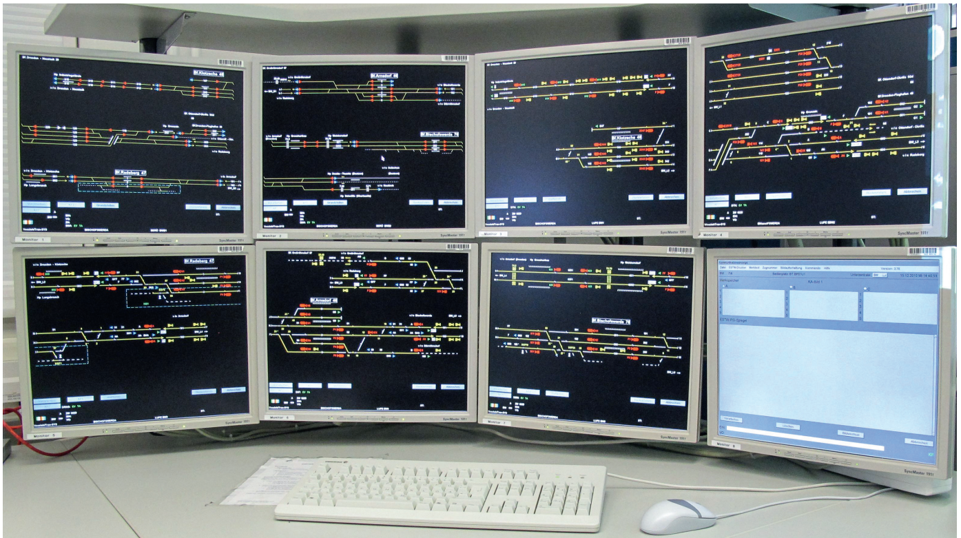
Abb. 2: Der Arbeitsplatz des Fahrdienstleiters im elektronischen Stellwerk (Darstellung der Simulation Best)

Homepageveröffentlichung unbefristet genehmigt für DLR / Rechte für einzelne Downloads und Ausdrücke für Besucher der Seiten genehmigt von DVV Media Group, 2018.