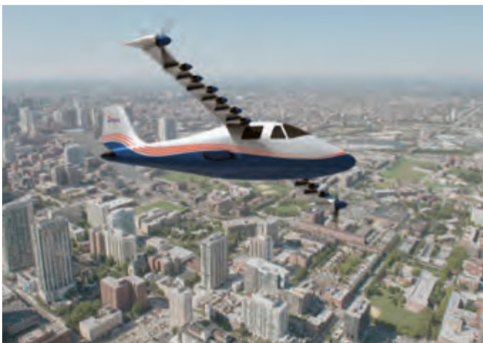
Elektrische Antriebe erlauben komplett neue Flugzeugkonfigurationen wie hier beim NASA-X-57-Demonstrator