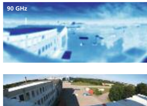
Abb. 2: Radiometrische Aufnahme des ABOSCA-Systems bei 90 GHz (oben) und optisches Bild (unten) eines komplexen Szenarios (Azimutwinkelbereich 180°)

erkundung erlaubt eine tageszeitunabhängige, zerstörungsfreie Beobachtung und Untersuchung interessierender Objekte bei nahezu allen Wetterbedingungen ohne künstliche Bestrahlung von Personen oder Gebieten. Ein Millimeterwellen-(MMW)-Radiometer ist ein potenzieller Kandidat für den Aufbau von hochauflösenden und hinreichend empfindlichen Detektoren, welche zuverlässig und leicht zu handhaben sind. Die Entwicklungen passiver Sensoren beim DLR beinhalten vollmechanische und vollelektronische Abtastergeräte sowie Hybride aus beiden. Das Hauptziel dabei ist eine hohe Leistungsfähigkeit bei der Abbildung bei gleichzeitig niedrigen Kosten und geringem Aufwand.