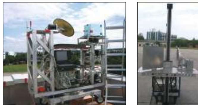
Abb. 1: Photographien des ABOSCA-Systems zur experimentellen Abbildung großer Szenarien (links) und des LPAS-Systems zur Detektion verborgener Objekte unter der Kleidung von Personen (rechts)

Mikrowellen sind in der Lage, Kleidung und eine Vielzahl anderer Materialien zu durchdringen, und sie erlauben daher das Aufspüren verdeckter Objekte durch das Anzeigen von dielektrischen Anomalien. Passive Mikrowellen-Fern-