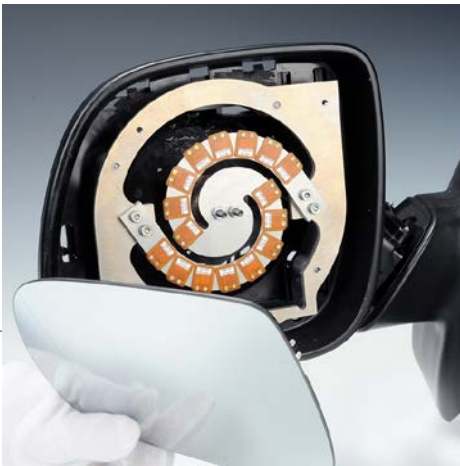
Außenspiegel mit einem aktiven Interface Exterior rear-view mirror with an active interface

[EN] Vibrations of interior and exterior rear-view mirrors occur at many different vehicles and compromise comfort and functionality. This applies particularly to trucks, vans and motorcycles.